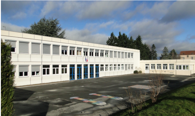
Ecole Primaire Charles-Louis Philippe