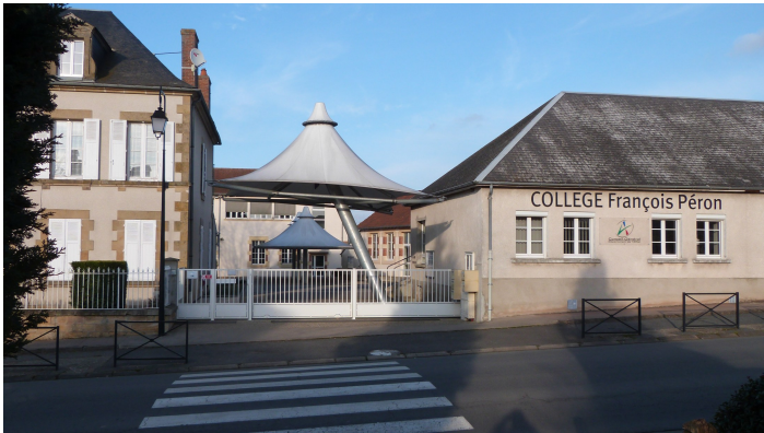
Collège François Péron